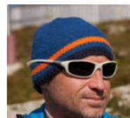
Sektion Grünberg Andreas Würflinger Im Tal 17 4656 Kirchham