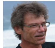
Sektion Feuerkogel Helmut Stüger Hintere Rindbachstr. 14 4802 Ebensee